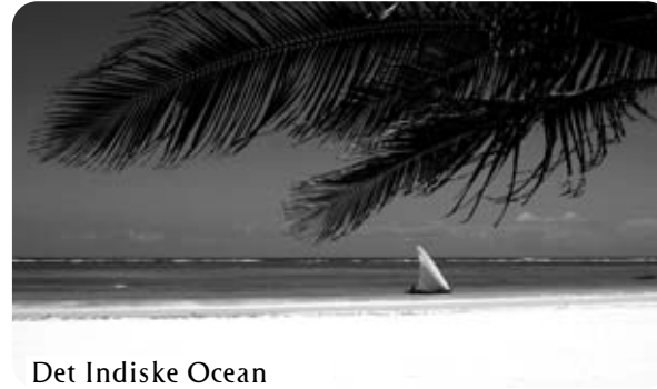
Det Indiske Ocean